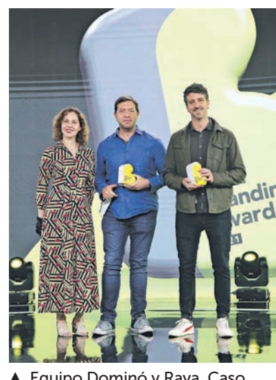
▲ Equipo Dominó y Raya. Caso "Sorry Burger".