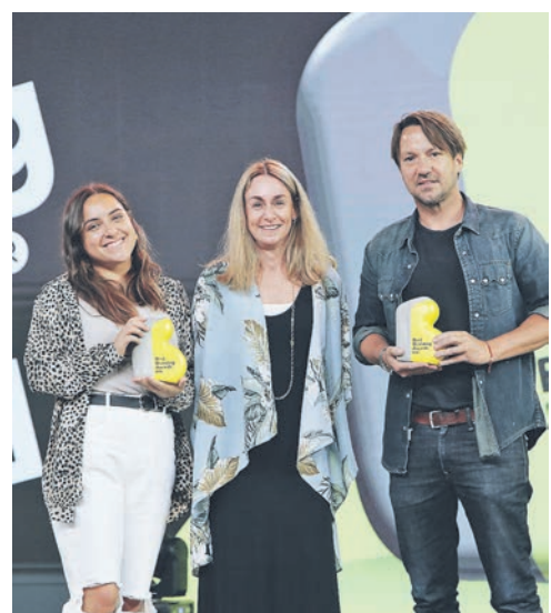
▶ Equipo Tempo y Pullpo. Caso "Tempo - Financrancia".