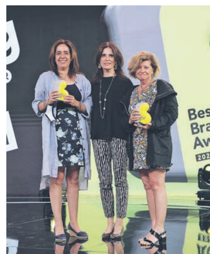
◀ Equipo Polpaico e Imax. Caso "Nueva Identidad Polpaico".