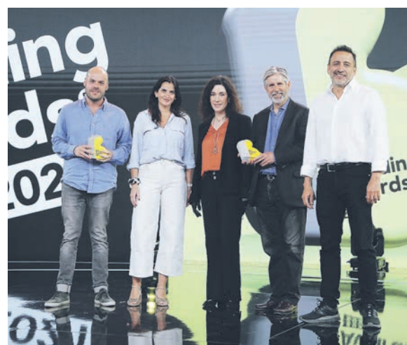
▲ Equipo Santander y Porta. Caso "WorkCafe.cl".