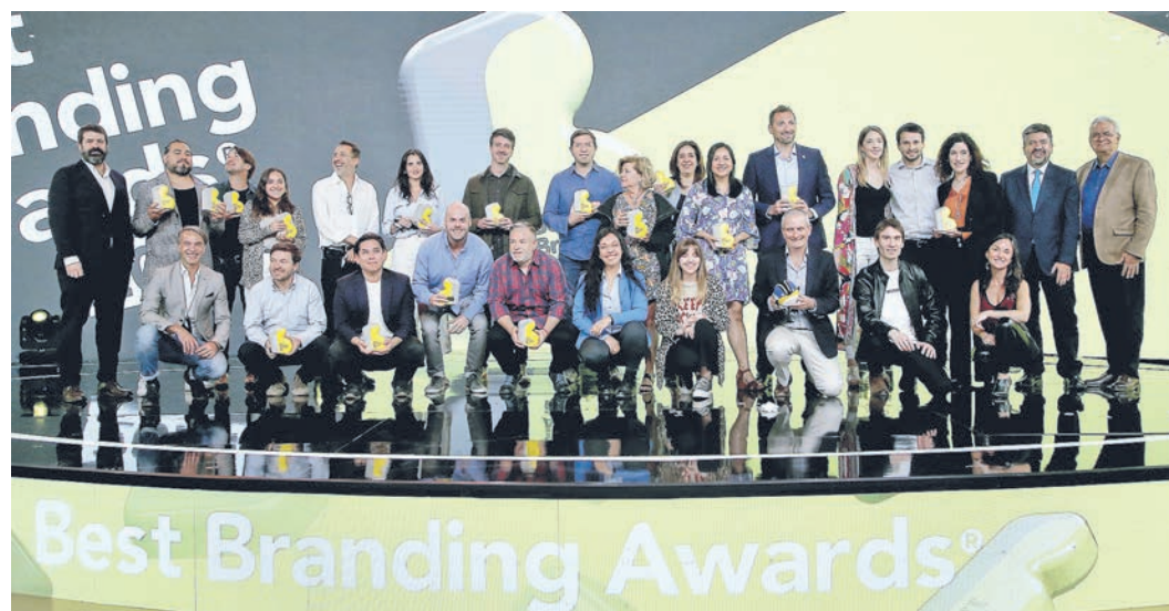
▲ Ganadores Best Branding Awards 2021.

En una ceremonia presencial y reducida a la que asistieron ganadores y patrocinadores del programa, Best Branding Awards en su primera versión, distinguió casos en nueve categorías. En la ceremonia se entregó también la distinción Branding Challenge.