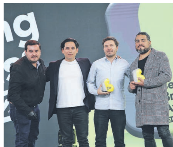
▲ Equipo Simplex y Fuego Company. Caso "Simplex, un Branding escalable".