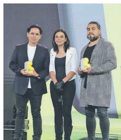
▲ Equipo Fastandgood y Fuego Company. Caso "De Fast & Good a Cubeta Gang!".