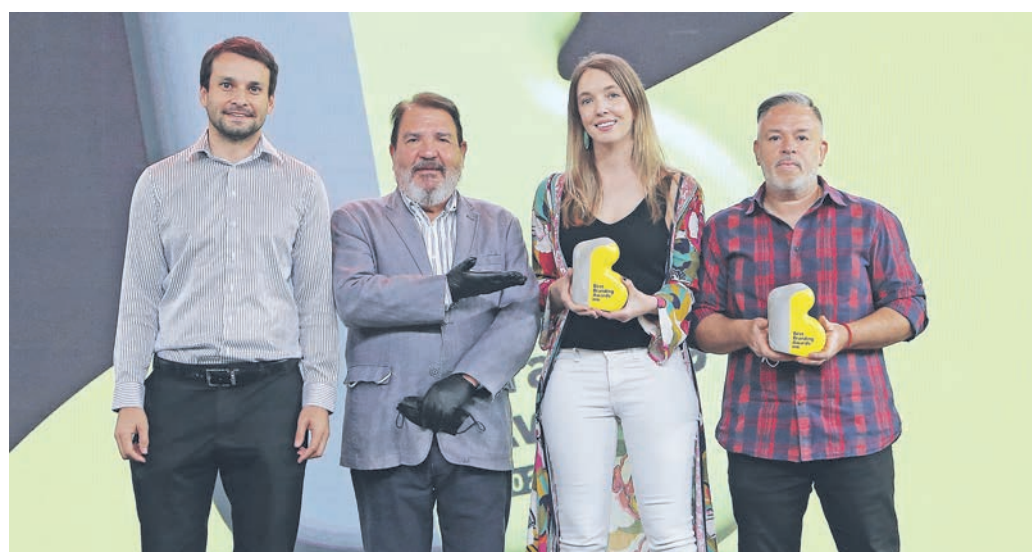
▲ Equipo Nestlé y Publicis. Caso "Nuevas Maggi de la Huerta".