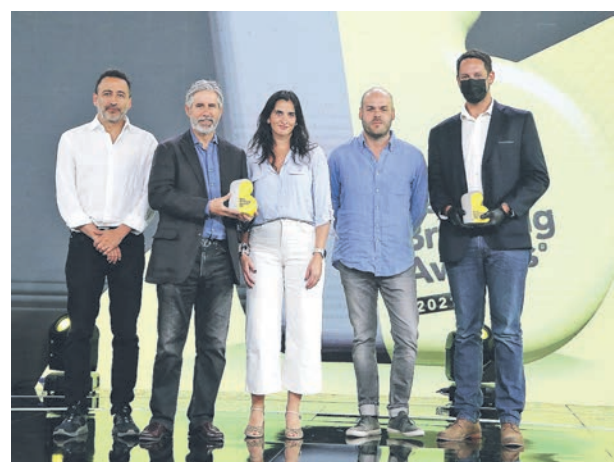
▲ Equipo Santander y Porta. Caso "Banco Santander Chile".