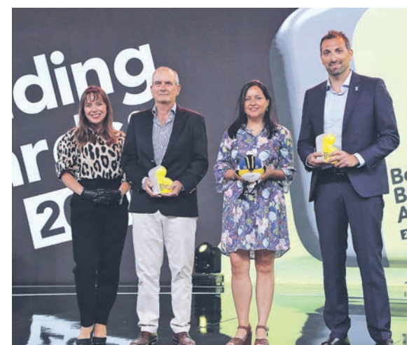
▲ Equipo Santiago2023 y b2o. Caso "Santiago2023".